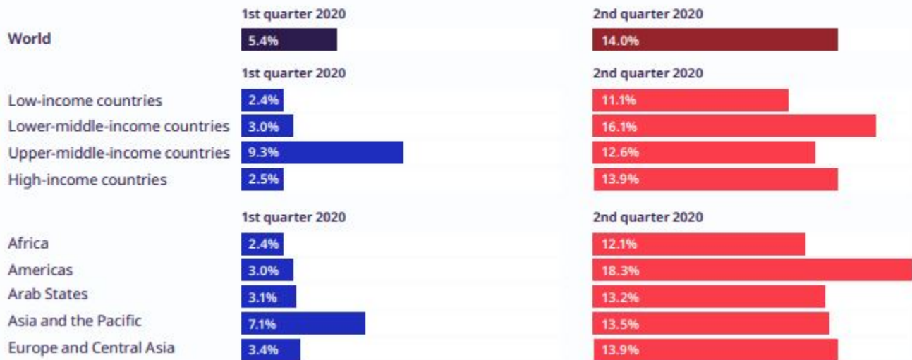
► Figure 3. Working-hour losses, world and by income group, first and second quarters of 2020 (percentage)