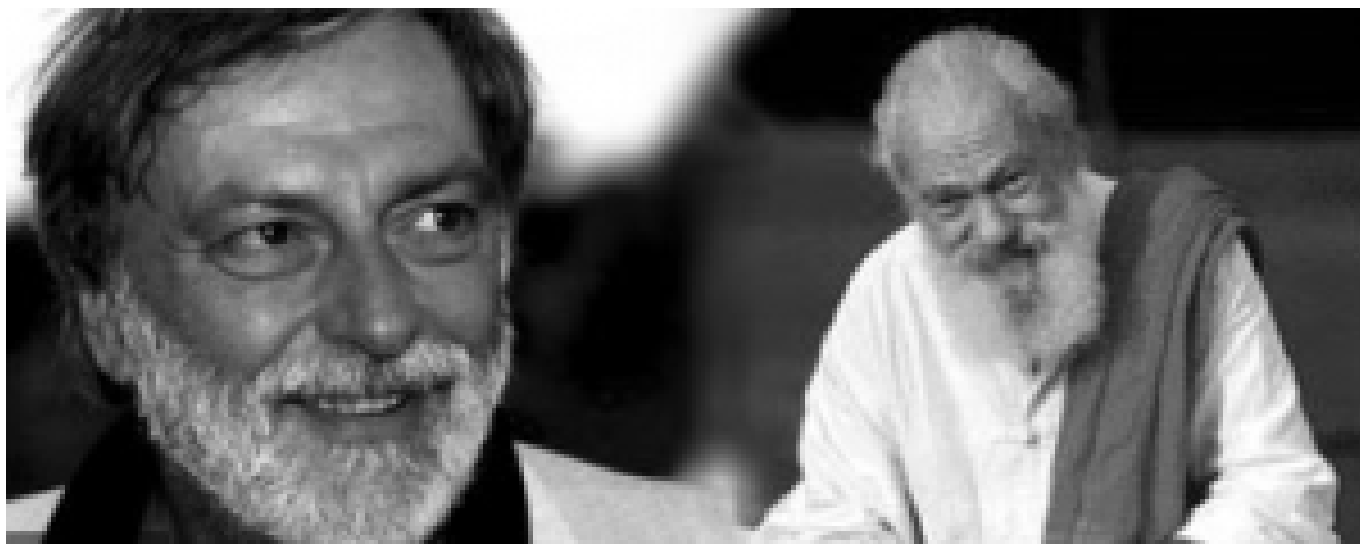
Tiziano Terzani e Gino Strada